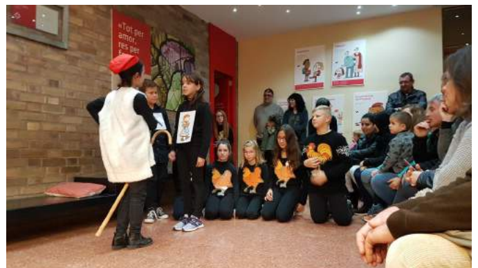
Alumnes de cinquè i sisè.

La mateixa tarda de la celebració de la festa de Nadal a l'escola també es van realitzar els següents actes: el sorteig de la cistella de l'AMPA, l'entrega