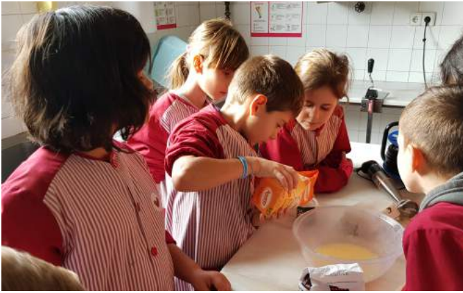
4. Then, add two cups of sugar.