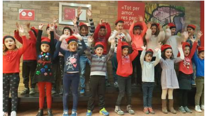
Alumnes de segon.