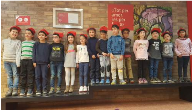
Alumnes de primer.