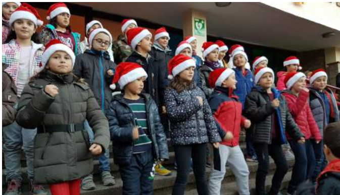
Alumnes de tercer i quart.