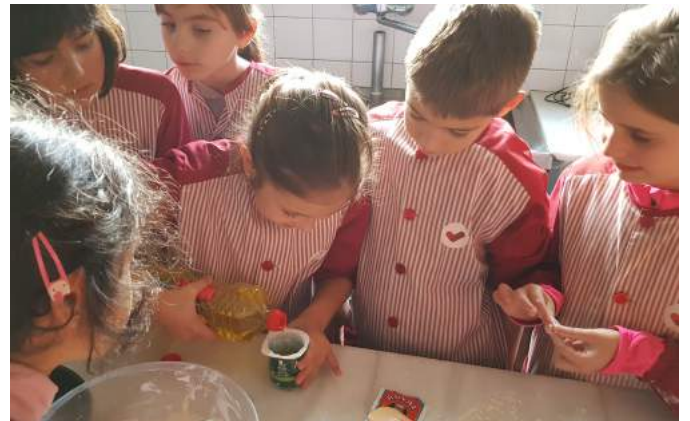
7. And finally, add one cup of oil.