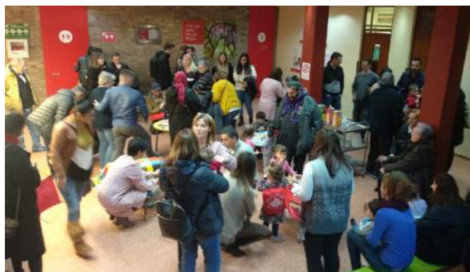
Famílies i infants gaudint del berenar.