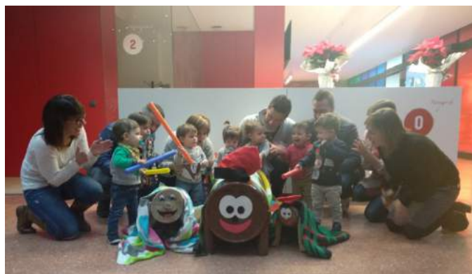
Alumnes de l'aula de les tortugues.