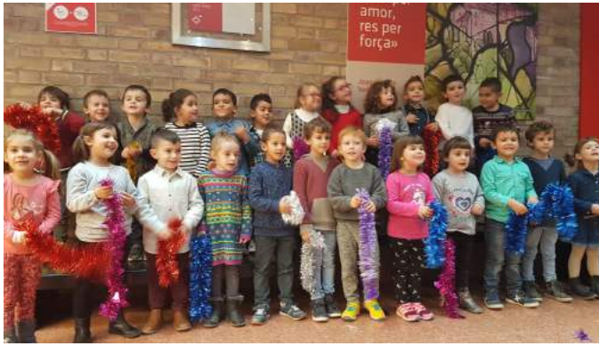
Alumnes de P-4.