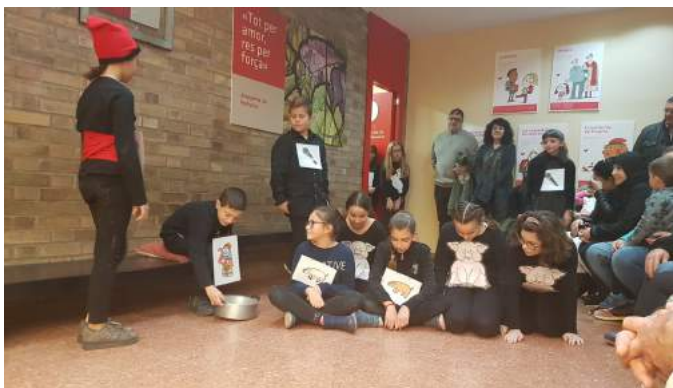
Alumnes de cinquè i sisè.