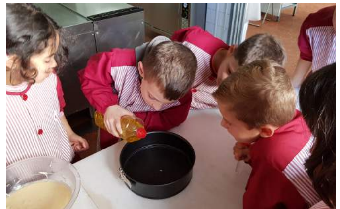
9. Grease the cake-tin with a little oil.