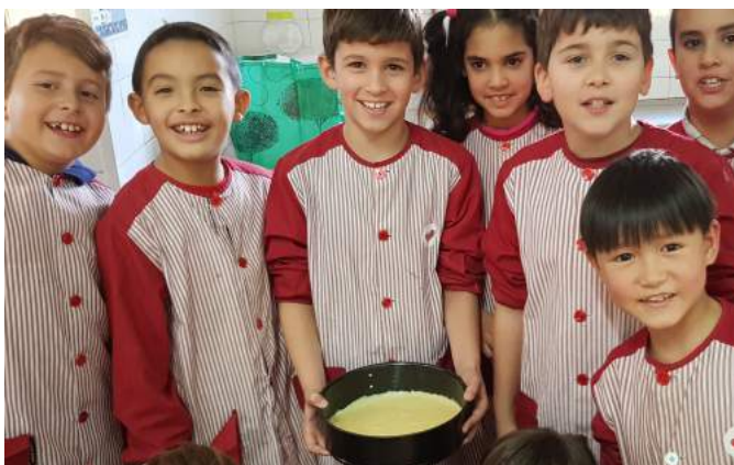
10. and put the mixture in the cake-tin.