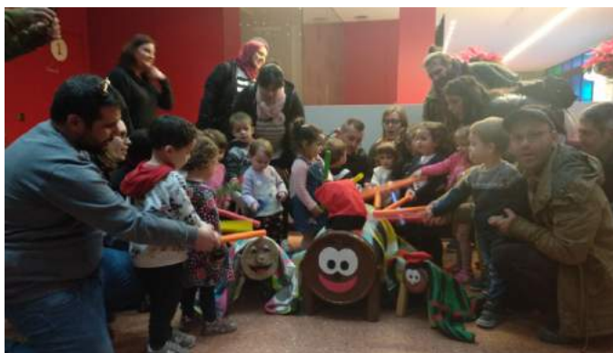
Alumnes de l'aula dels peixets.