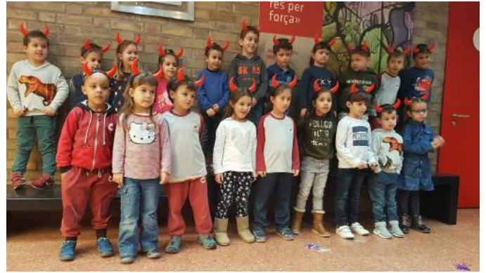
Alumnes de P-5.