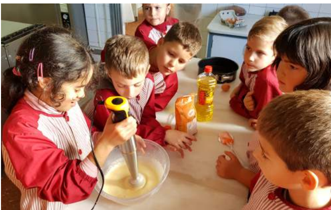
8. Mix everything in the bowl.