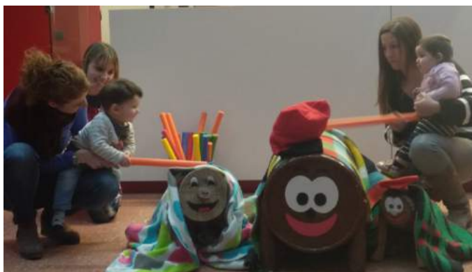
Alumnes de l'aula dels cargolets.

La festa va continuar al vestíbul de l'escola on els infants juntament amb les seves famílies van fer cagar el tió, i seguidament van gaudir tots d'un berenar amb dolços nadalencs ●