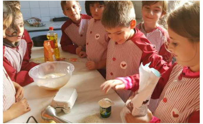
5. Add three cups of flour.