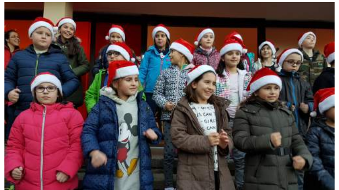
Alumnes de tercer i quart.