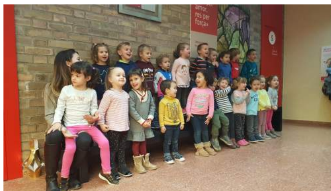
Alumnes de P-3.

Per a l'ocasió el vestíbul de l'escola es va omplir de famílies, de versos de Nadal, de cançons de Nadal i de màgia, i l'esperit nadalenc es va fer ben present en l'ambient durant tota la jornada.