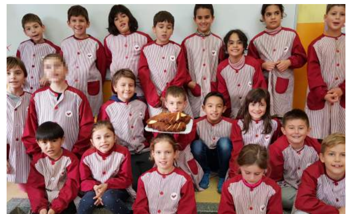
11. Put the cake-tin in the oven at 150°C and after 45 minutes, take the cake-tin out carefully. Enjoy your meal! ●