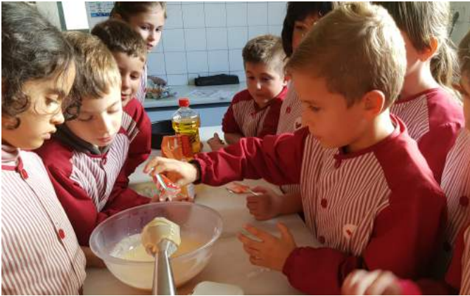
6. Add one sachet of baking powder.